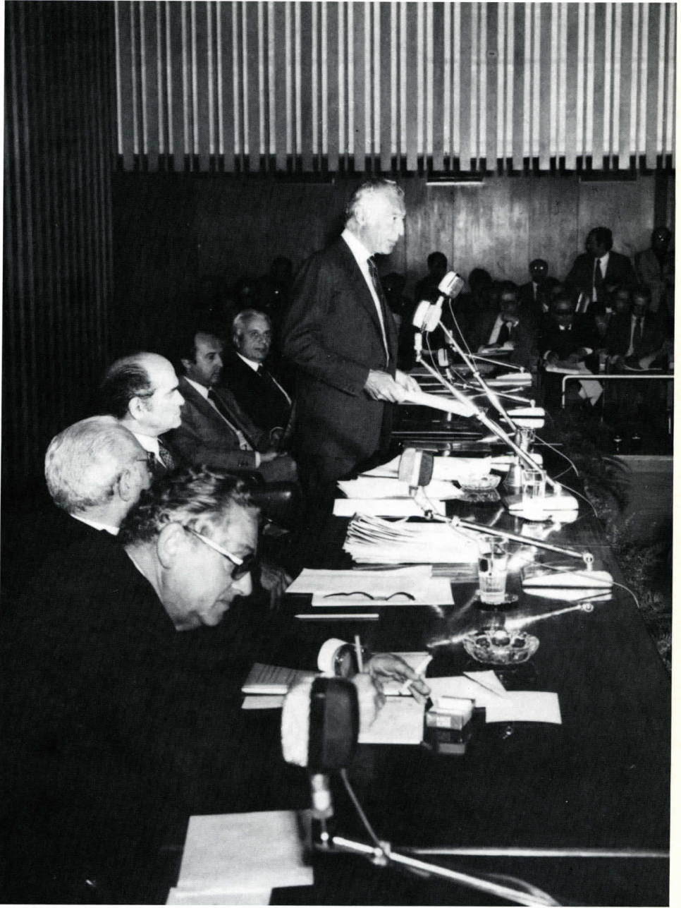
Il tavolo di presidenza durante i lavori dell'Assemblea.