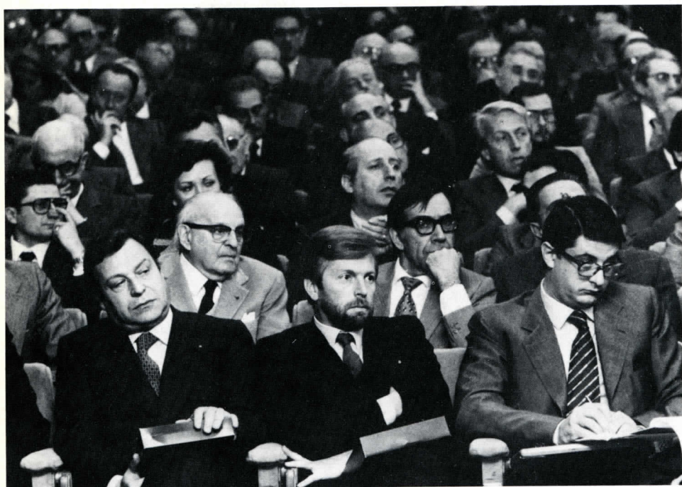
Particolari del salone dell'Associazione durante i lavori dell'Assemblea.