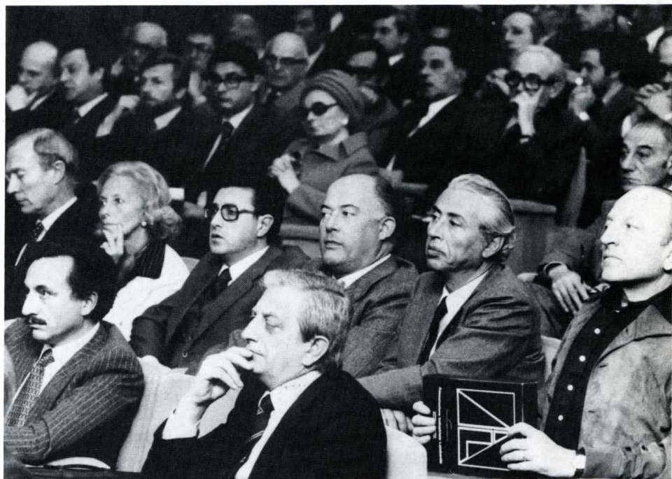
Particolari del salone dell'Associazione durante i lavori dell'Assemblea.