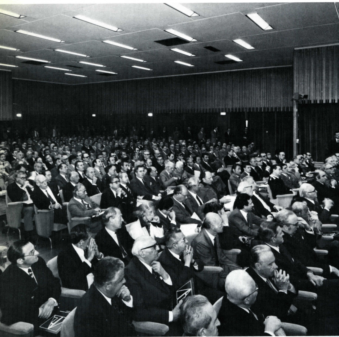
Il salone dell'Assemblea durante lo svolgimento della relazione del Presidente dell'Associazione.