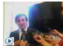
Rcs, Cairo: mi fa piacere se soci