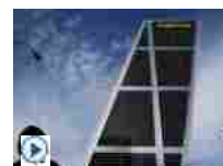
Banche spagnole, ancora in calo le