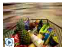
Sale l'inflazione nel Regno Unito, + 0,5% a