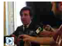
Rcs, Cairo: non c'è nessun ipotetico